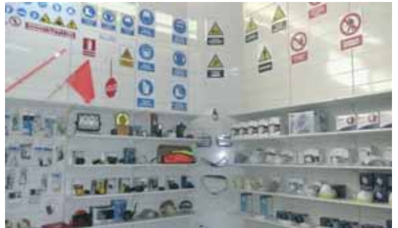
SALA DE VENTAS SHOWROOM