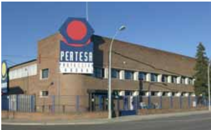
ALMACÉN Y OFICINAS CENTRALES WAREHOUSE AND HEAD OFFICE