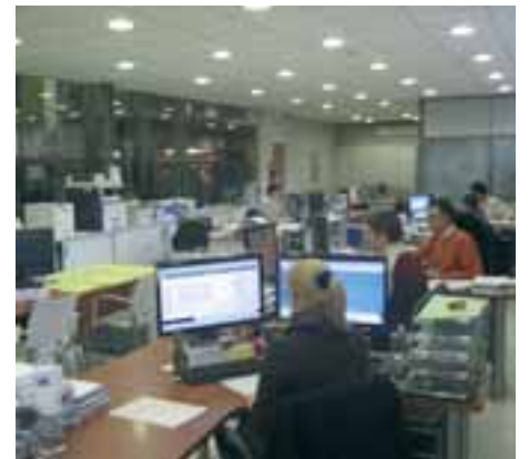
OFICINAS CENTRALES HEAD OFFICE