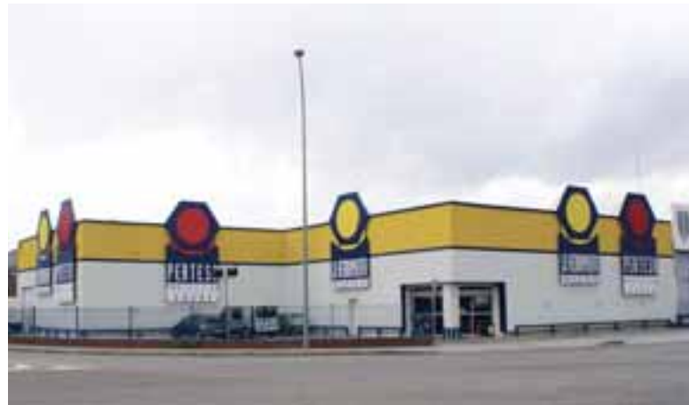
DELEGACIÓN PALENCIA PALENCIA OFFICE