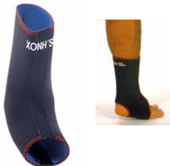
REF. 250 TOBILLERA / REF.200 ANKLE BAND