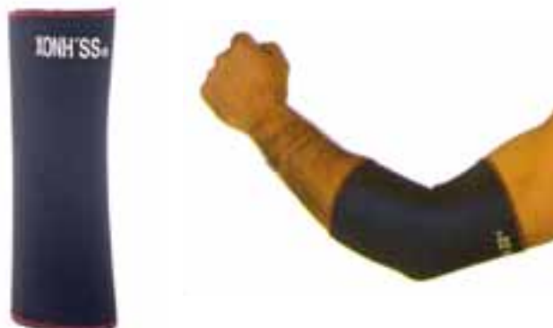
REF.240 CODERA / REF.240 ELBOW WRIST BAND