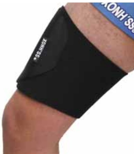
MUSLERA / MUSCLE BAND

APLICACIONES: Strong and chronic knee and its surroundings Osteoarthritis, Arthritis, Bursitis, Chondromalacia Inflammation of the tendon Rehabilitation post-surgical or post-traumatic. SEAMLESS sealing 2 mm neoprene