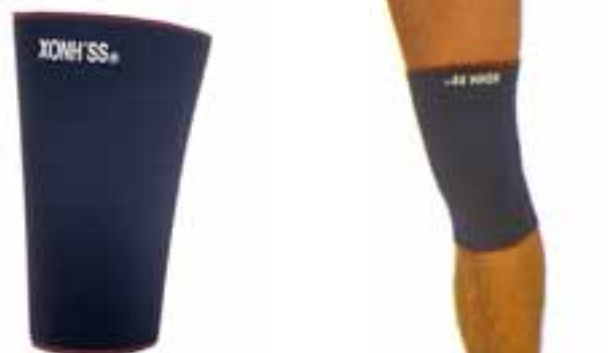
REF. 220 RODILLERA / REF.200 KNEE BAND

APLICACIONES: Pain in the elbow, rheumatism, and articulation. Bursitis, Epicondylitis, Tendinitis. Inflammation of the tendon. Rehabilitation. SEAMLESS sealing 2 mm neoprene.